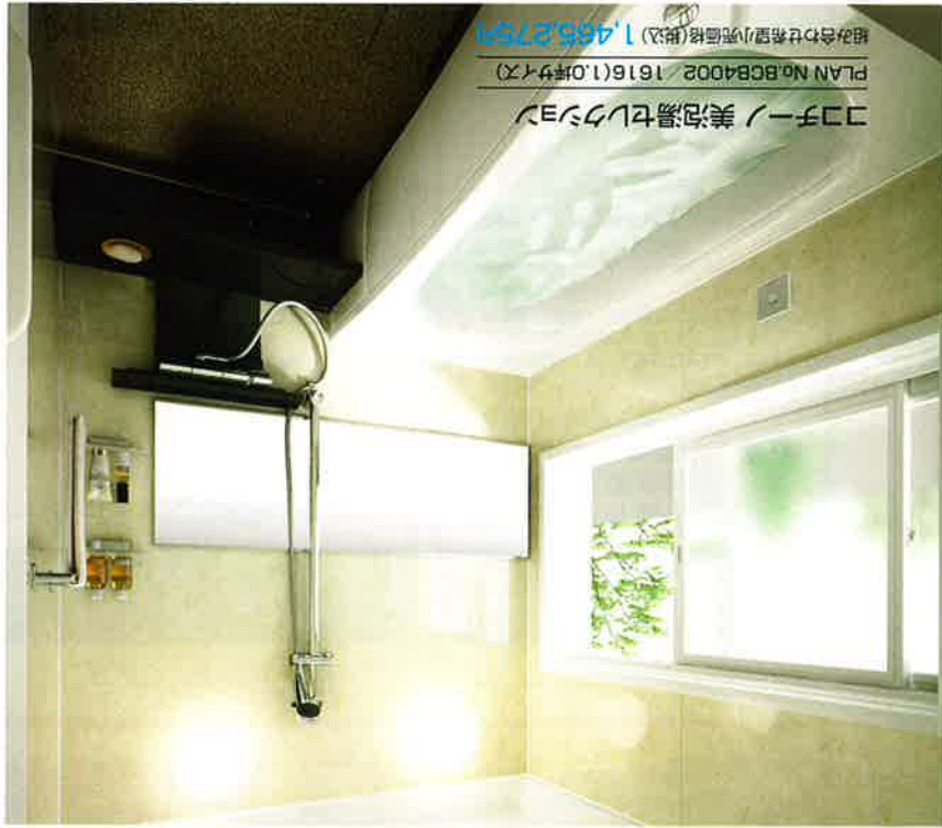
ココチーノ美泡湯セラクシヨソ

酸素を含んだミクロの泡で、身体ほっかほか、お肌とらさせてくれること人気の「酸素美泡湯」。浴槽やカウンターの「アコヒカ素材」を採用するなど、オリジナルの機能やアイテムなどを搭載しました。